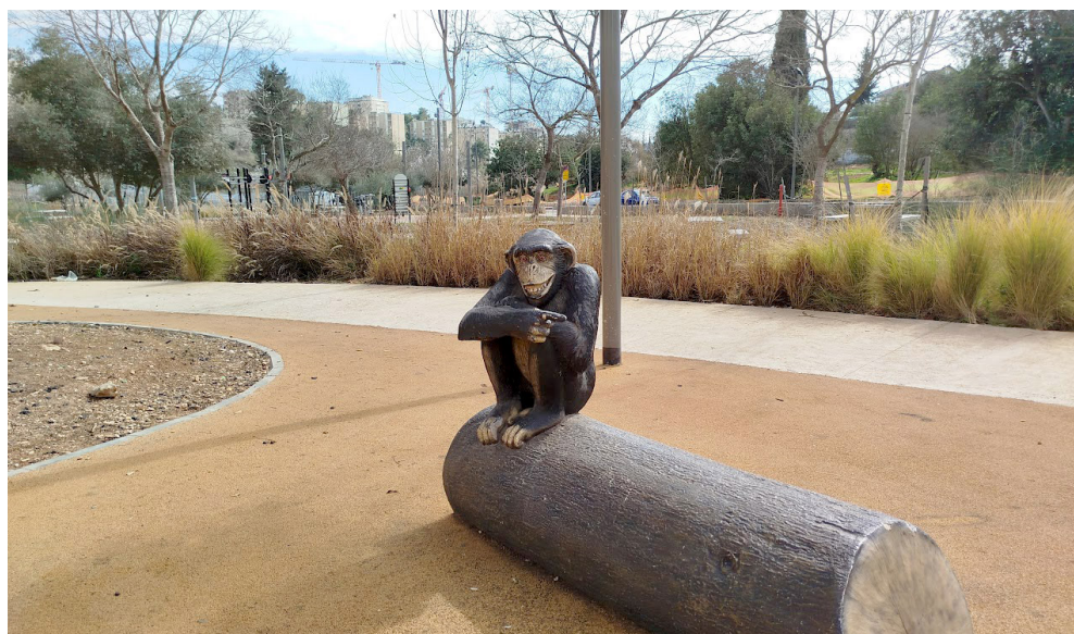
פארק העץ, עיר גנים