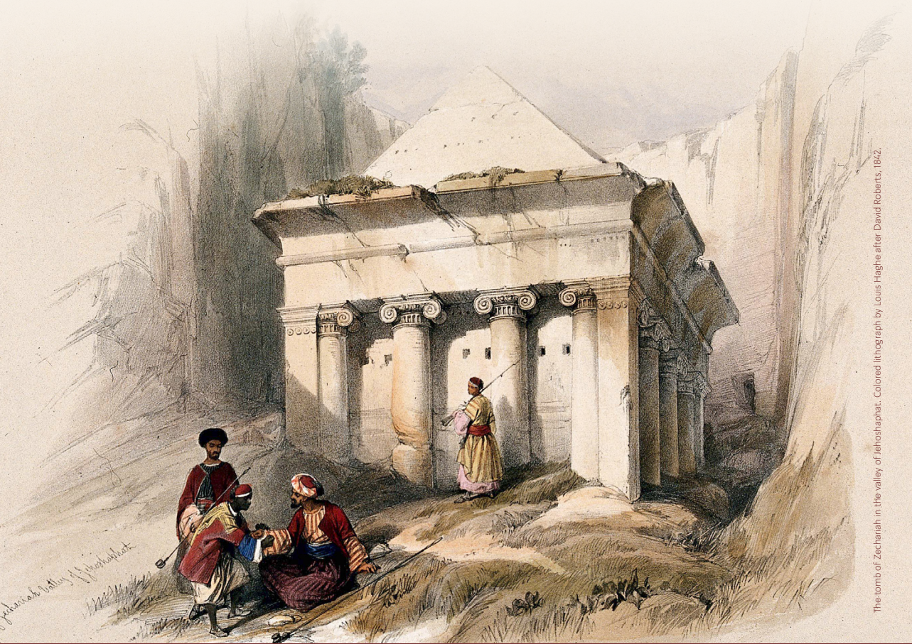
The tomb of Zachariah in the valley of Jehoshaphat. Colored lithograph by Louis Haghe after David Roberts, 1842.

יד יצחק בן־צבי, רח' אבן גבירול 14, ירושלים